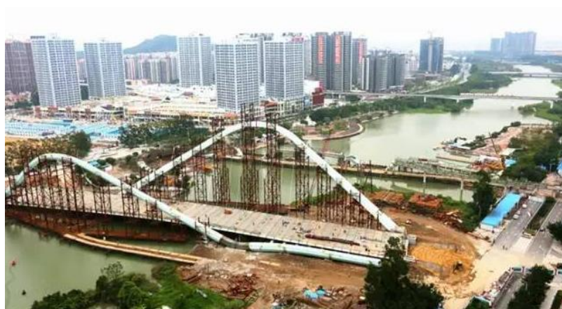
图：建设中的蕉门河双桥。

在市政基础设施方面，蕉门河双桥工程主体结构安装已全部完成，计划今年底贯通，明年 4 月通车，可有效加强蕉门河东西两岸交通联系。南沙图书馆、南沙档案信息规划展览中心、区少年宫等项目正加快推进，力争完善蕉门河中心区“微循环”系统。