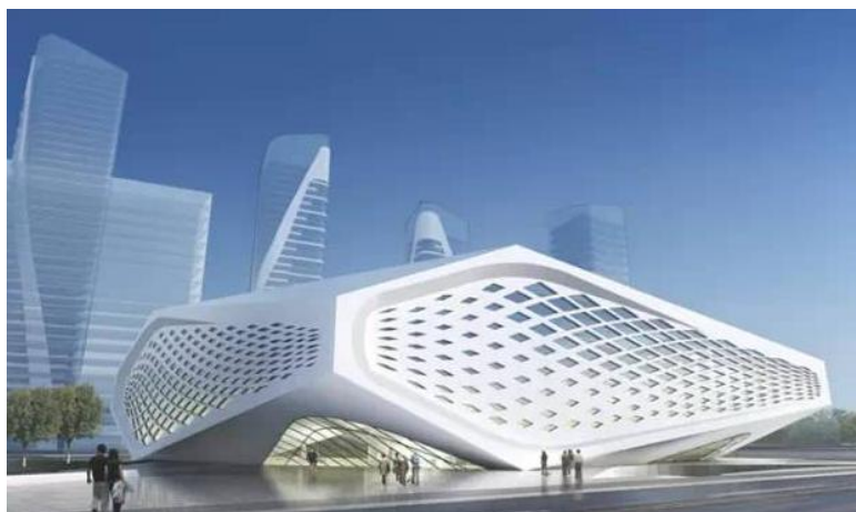
图：南沙区新图书馆效果图。

中心医院二期即将交付！图书馆档案馆少年宫正加紧推进！华师第二附中和广外附小附幼正在施工！