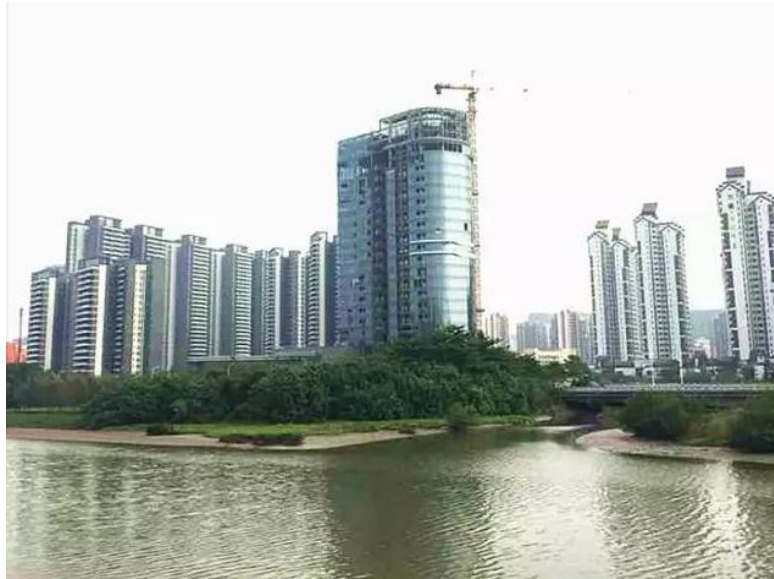
图：南沙越秀喜来登酒店建设中。

南沙万达广场项目已于 12 月 22 日开业运营，有效地提升了蕉门河中心区商业服务能力和档次。紧接其后投入使用的，会是喜来登酒店。现在喜来登酒店项目已基本完成主体工程建设，预计明年中即可对外营业。另外，璧珑湾双子塔也顺利封顶，目前外立面施工已完成。