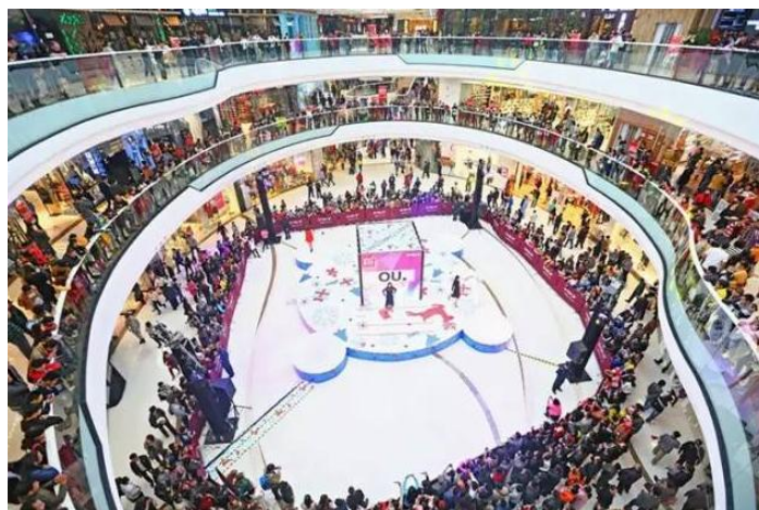
图：开业后的南沙万达广场。