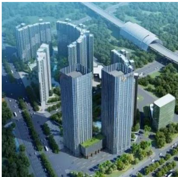
图：璧珑湾双子塔效果图。

南沙万达广场项目已于 12 月 22 日开业运营，有效地提升了蕉门河中心区商业服务能力和档次。紧接其后投入使用的，会是喜来登酒店。现在喜来登酒店项目已基本完成主体工程建设，预计明年中即可对外营业。另外，璧珑湾双子塔也顺利封顶，目前外立面施工已完成。