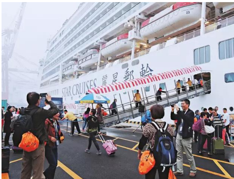
丽星邮轮“处女星号”外观非常漂亮，不少游客在出发前兴奋留影。