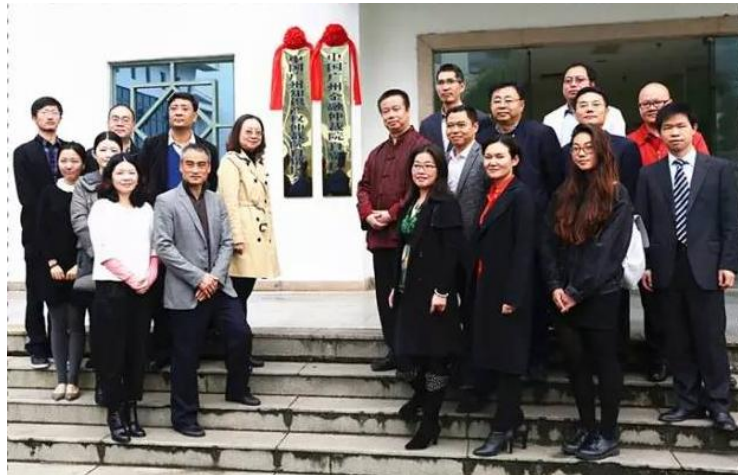
12月30日,全国首家自贸区法院——广东自由贸易试验区南沙片区人民法院揭牌成立。