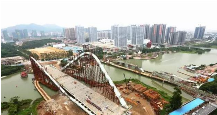
图：蕉门河双桥建设现场。

随着万达广场正式开业、南沙蕉门河中心区双桥相继合拢、蕉门河中心区城市服务功能不断完善，南沙“城市客厅”已格局初显。朋友圈除开万达，让我们一起来看看蕉门河现在周边的商业配套进展怎样，公共服务设施建设如何，景观又将有怎样的变化吧！