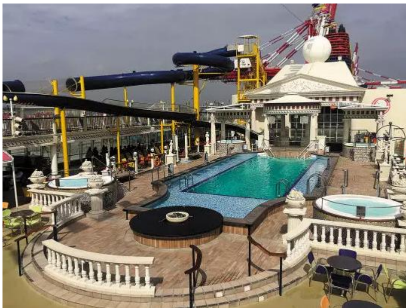
顶层泳池 顶层豪华游泳池非常漂亮。

2016年1月3日，广州南沙港迎来首批邮轮旅游游客——近2000名游客搭乘丽星邮轮“处女星号”，前往三亚、越南。