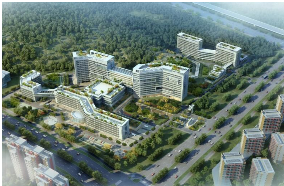
图：南沙中心医院二期效果图。

南沙中心医院二期预计年内交付使用，二期后续工程正进行基坑支护及桩基础施工，累计完成合同金额 90%。市妇儿中心南沙院区也在稳步推进建设中。华南师范大学附属小学及幼儿园已投入使用，华南师范大学第二附属中学则正在开展基坑施工和桩基础施工。广州外国语学校附属小学及幼儿园项目已开展土方回填和软基处理施工。