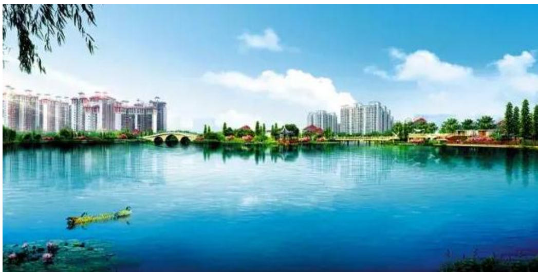
图：凤凰湖中心岛效果图。

“一涌”项目（河涌及两岸综合整治），工作范围内的金洲涌西段（蕉门河-环岛西路）景观提升工程已完成一期建设。